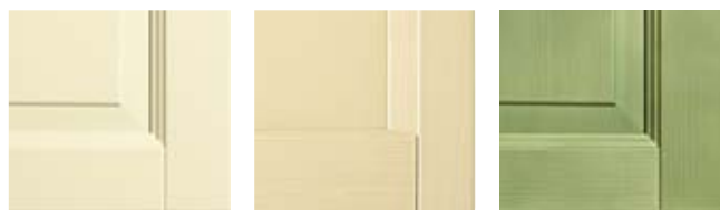
AVORIO V07 AVORIO POSITIVO V14 VERDE POSITIVO V13