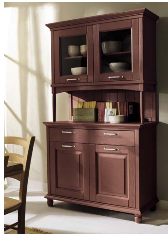
A LATO DELLA CUCINA LA ZONA PRANZO, REALIZZATA CON TAVOLO E ANGOLO PANCA IN MASSELLO È COMPLETATA DA QUESTA CREDENZA CON VETRINA DALLE LINEE TRADIZIONALI CHE RIPRENDE I TEMI DELLA CUCINA E NE È IL GIUSTO COMPLEMENTO: LA CREDENZA È IN ABETE TINTO NEL COLORE ROSSO GRANATA.