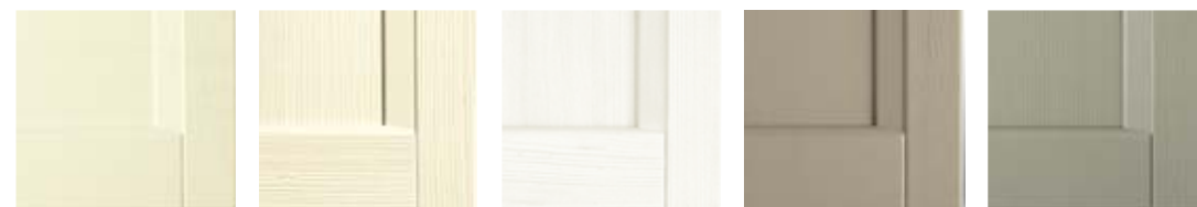
LINO V45 NEVE V20 GESSO V47 VISONE V50 CRETA V52