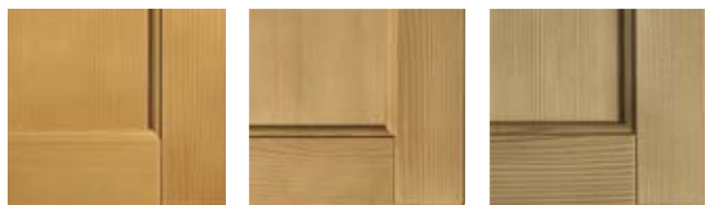
BISCOTTO V04 PAGLIAFIENO V16 MALTO V80