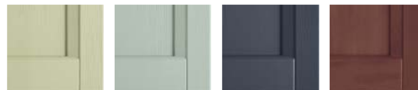
VERDE LICHENE V53 AZZURRO FIORDO V54 BLU COBALTO V55 ROSSO GRANATA V51