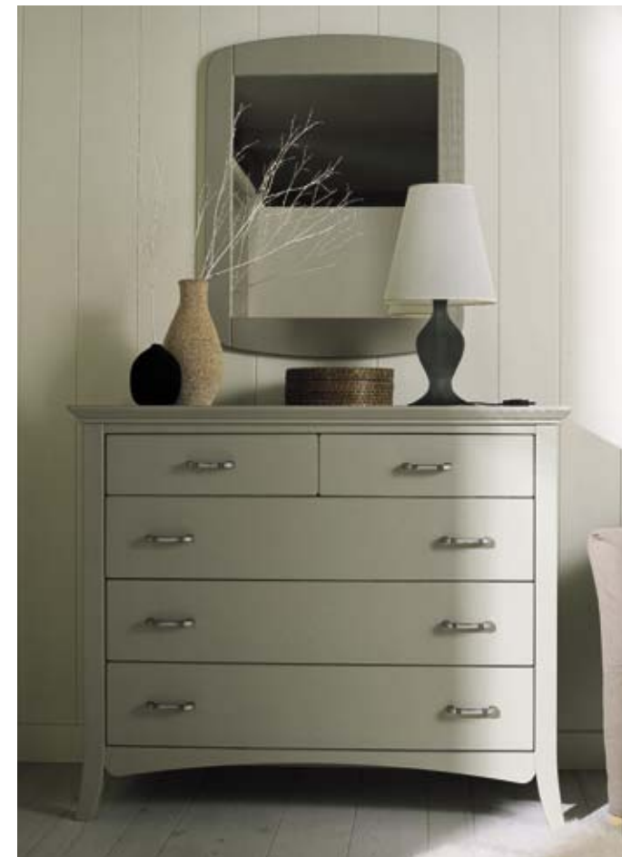
UNO SPAZIO DI SERVIZIO CON AMPIA ARMADIATURA A TUTTA ALTEZZA IN COLOR LINO CREA UN DIAFRAMMA CON LA ZONA NOTTE. IN QUESTA PAGINA IL COMÒ IN TINTA CRETA, COMPLETATO DA UNA SPECCHIERA.