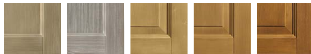
NOCCIOLA V37 ARDESIA V38 CENERI SPAZZOLATO ANTICATO V21 BISCOTTO SPAZZOLATO ANTICATO V22 TABACCO SPAZZOLATO ANTICATO V23