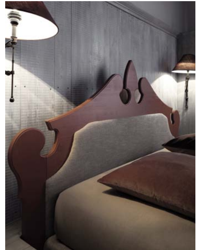
(SOPRA) LA TESTIERA DEL LETTO PUÒ, IN OPZIONE, ESSERE DOTATA DI UN PANNELLO IMBOTTITO, NELLE FINITURE DEL SOMMIER, CHE ESALTA LA CORNICE PERIMETRALE: LA TESTIERA (MAGINE GRANDE) RESTA LEGGERMENTE STACCATA DALLE DOGHE DELLA BOISERIE REALIZZATE CON UNA FINITURA A TAGLIO DI SEGA; IL MATERASSO APPOGGIA SOPRA UN SOMMIER RIVESTITO CON TESSUTO CHE SCENDE A TERRA.